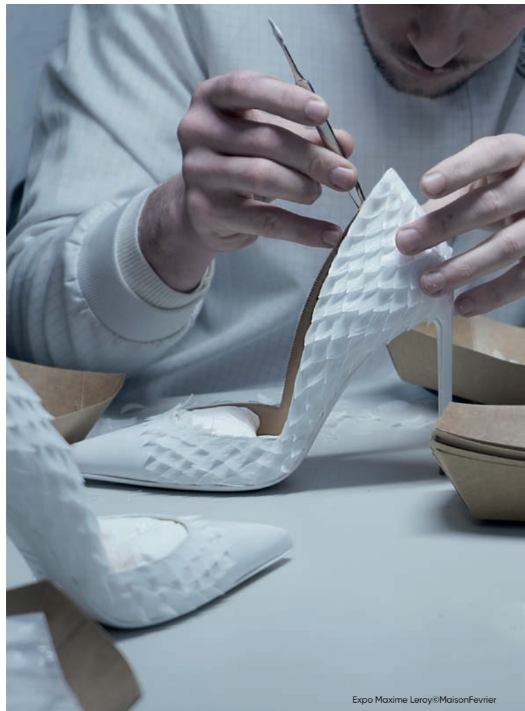
Expo Maxime Leroy

Le parcours peut être complété avec un atelier plastique : 150€ (visites des 2 expositions + atelier).